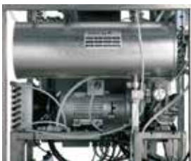
Separated steam generator with water booster pump / Generatore di vapore esterno con pompa d'acqua