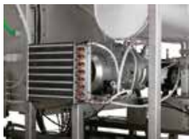
Condensate drain cooler and vacuum pump / Raffreddamento della condensa sullo scarico e della pompa del vuoto