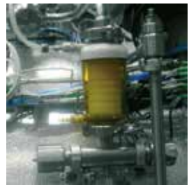
Decontamination of exhaust air with sterile filter / Decontaminazione dell'aria di scarico con filtro sterile