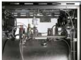
Modulating valve on steam inlet Valvola modulante nell'ingresso vapore